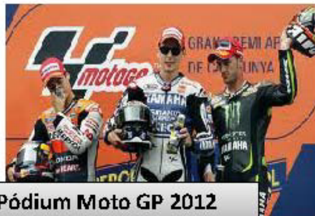
Pódium Moto GP 2012