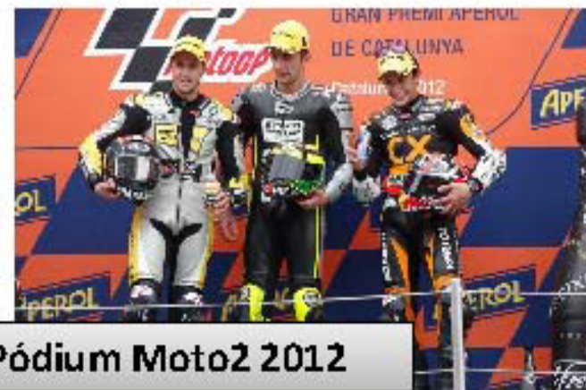
Pódium Moto2 2012