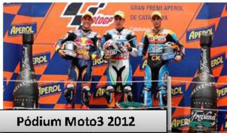
Pódium Moto3 2012